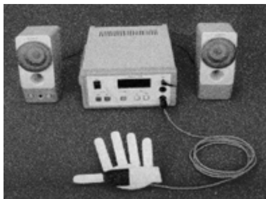
図3 試作装置の外観

試作した装置を高齢者施設に持ち込み利用者の反応を調べた。高齢者では関節が硬い、指の曲りが少ない、指曲げが遅い、指に変形がみられるといった場合があり、